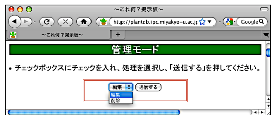
図6 これ何掲示板管理モード(新)