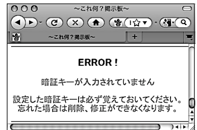
図4 エラーメッセージ